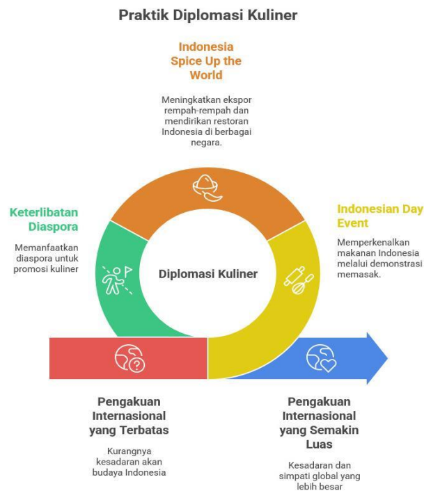
Gambar 2. Praktik Diplomasi Kuliner

Keberhasilan dalam diplomasi kuliner memiliki hubungan erat dengan keterlibatan pemerintah dan non-pemerintah, termasuk diaspora, asosiasi kuliner dan pelaku usaha. Dengan penggunaan diaspora di negara ini, secara langsung akan mendukung proses gastrodipomasi . Seperti Austria yang memiliki komunitas diaspora yang besar, sehingga mendukung promosi kuliner (Yayusman dan Mulyasari 2024). Beberapa cara yang dapat diadaptasi dalam upaya pengenalan kue tradisional Indonesia ke tingkat dunia adalah seperti yang tertuang pada gambar 2 sebagai berikut;