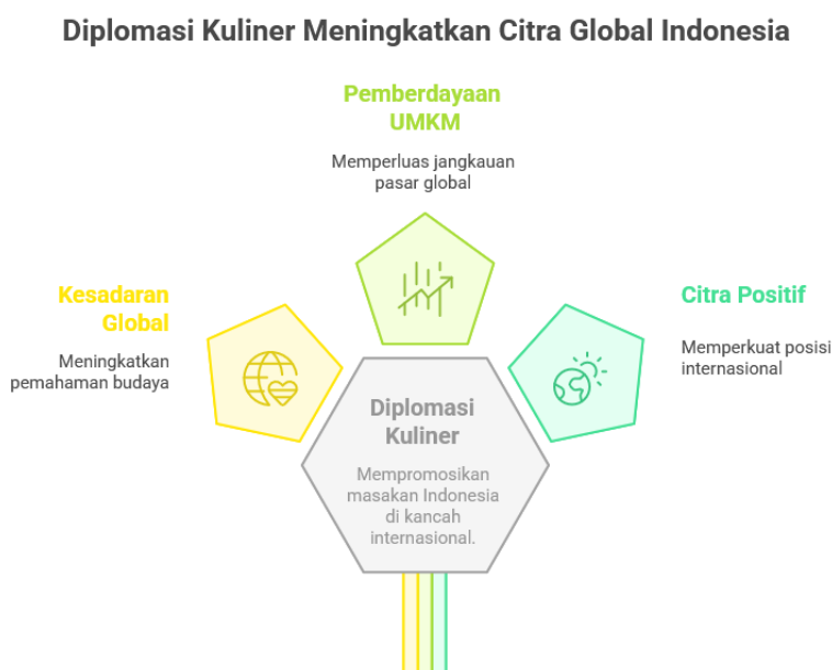
Gambar 3. Peluang

Penguatan UMKM kuliner dalam program Indonesia Spice Up the World akan membuka peluang besar dalam diplomasi kuliner Indonesia. UMKM tidak hanya sebagai penggerak ekonomi, tetapi juga sebagai duta budaya yang memperkenalkan kuliner Indonesia ke pasar global. Melalui inovasi produk, digitalisasi pemasaran, dan kolaborasi dengan diaspora dan jaringan internasional, UMKM dapat memperluas jangkauan kuliner Indonesia, meningkatkan ekspor, dan memperkuat citra dan posisi Indonesia di panggung dunia (Sophiana Widiastutie 2021). Berikut ini adalah beberapa tantangan yang dihadapi Indonesia dalam upaya menjadikan kue tradisional sebagai agen diplomasi kuliner. Ini disajikan pada gambar 3, sebagai berikut;